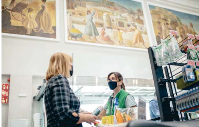
Una de las tiendas eficientes de Mercadona en Andalucía, instalada en una estación de autobuses.

La inversión de la compañía en Andalucía, por valor de 140 millones de euros, fue destinada tanto a la ampliación y optimización de sus tres bloques logísticos, ubicados en Guadix (Granada), Antequera (Málaga) y Huévar