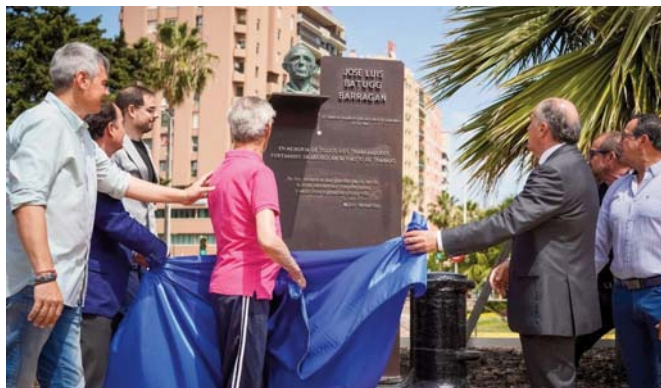
Un momento de la inauguración de la nueva ubicación del conjunto escultórico homenaje a los portuarios. VCG

Como explicó el presidente de la APBA, Gerardo Landaluze, "recordamos, damos las gracias y homenajeamos a los trabajadores del sector fa-