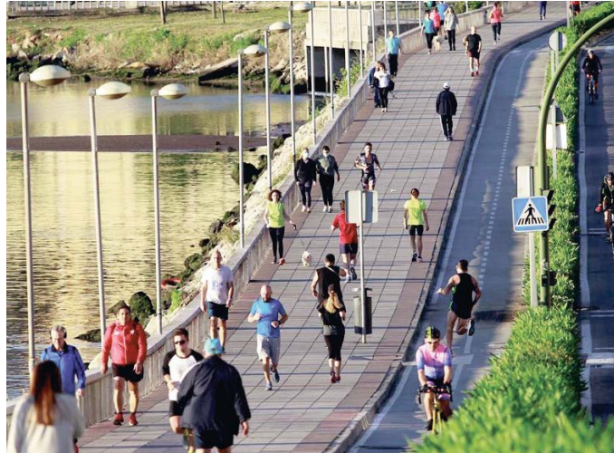
Personas de diversas edades caminan por la zona litoral de Algeciras.

Entre las particularidades de cada localidad, como sucede con Mari Luz, en Tarifa, el nombre de la patrona aparece entre los más frecuentes. De hecho, Mari Carmen, vinculado a la patrona de los marineros, debe a ese patronazgo su predominio comarcal. Ocurre igual, por ejemplo, con Inmacula-