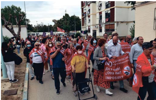
Cientos de personas tomaron parte ayer en una nueva manifestación contra Red Eléctrica.