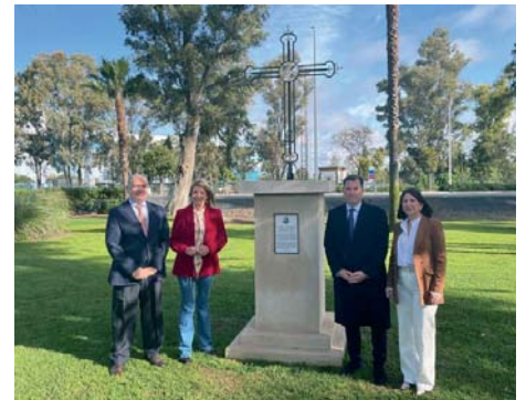
Cruz del Camino de Santiago en Colón.