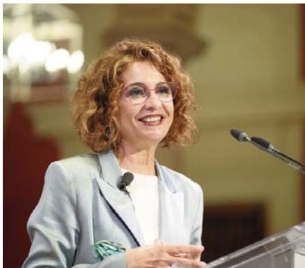
La ministra de Hacienda, María Jesús Montero.

Dijo que el Ministerio pretende posibilitar la sostenibilidad financiera de las entidades beneficiarias aplicando el mismo planteamiento de los planes de sostenibilidad financiera que se aprobaron en los acuerdos de la Comisión Delegada de 2023 y 2024, mejorando las condiciones de los préstamos.