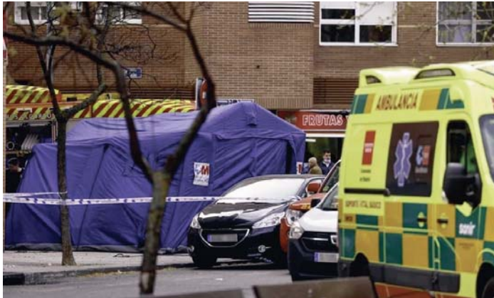
Bomberos y servicios de emergencias en las inmediaciones del garaje de Alcorcón.

Los sanitarios confirmaron la muerte de dos bomberos, que en un principio estaban ilocalizados. Además, 14 más resultaron heridos, uno de ellos de gravedad, que fue trasladado en ambulancia a la Unidad de Quemados del Hospital Universitario de Getafe. Asimismo, trasladaron al Hospital Fundación de Al-