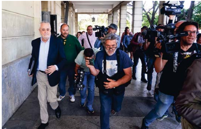
El ex presidente de la Junta José Antonio Griñán llegando a los juzgados.

Así se pronuncian los fiscales de Sevilla delegados de la Fiscalía Especial contra la Corrupción, después de que la Sección Primera de la Audiencia de Sevilla, al sopesar “el posible planteamiento de una cuestión prejudicial de interpretación ante el Tribunal de Justicia de la Unión Europea”; habilítase un plazo de diez días, para que las partes del procedimiento judicial informasen sobre si en este caso, el Constitucional “se ha