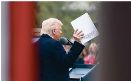
Donald Trump en el jardín de la Casa Blanca.

"Los trabajadores del acero, del automóvil, los agricultores y los artesanos cualificados (...) han sufrido realmente mucho, han visto con angustia cómo dirigentes extranjeros han robado nuestros empleos, cómo unos tramposos extranjeros han rapiñado nuestras fábricas y cómo unos extranjeros carroñeros han destrozado nuestro antaño hermoso sue-