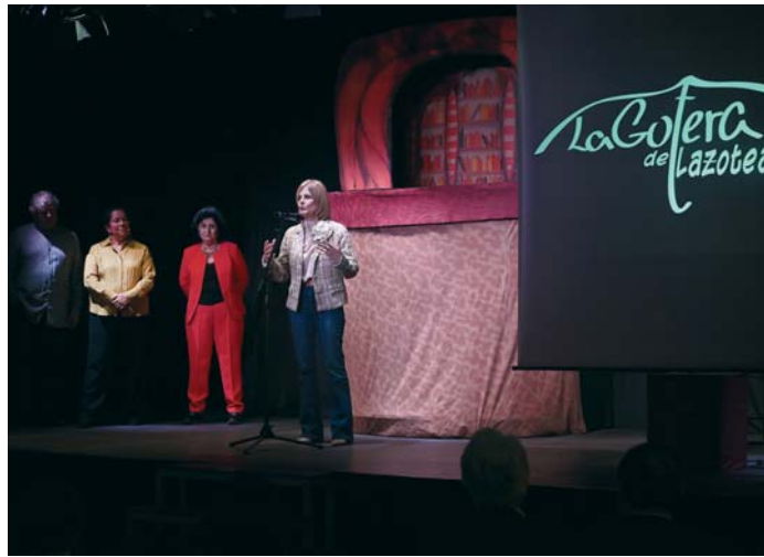
La alcaldesa junto a los promotores del teatro durante su intervención en la inauguración de ayer.