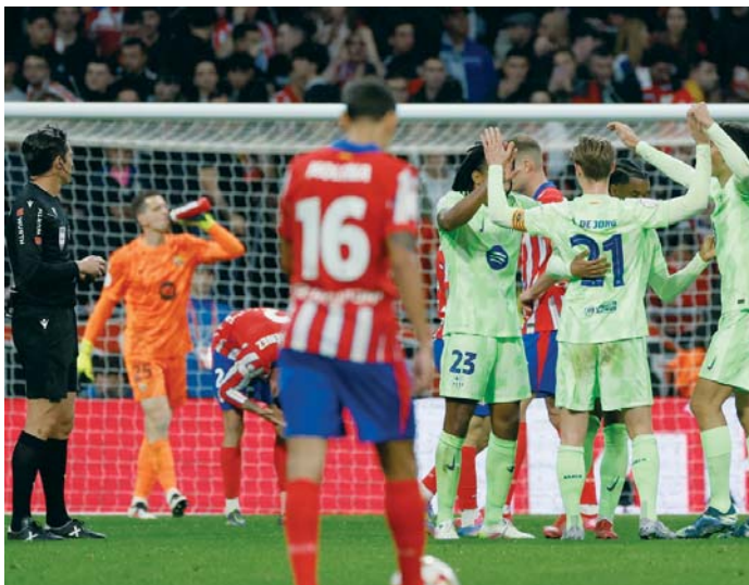
Los jugadores del FC Barcelona celebran la victoria tras el encuentro.

Incidencias: partido de vuelta de las semifinales de la Copa del Rey, disputado en el estadio Metropolitano ante 69.014 espectadores.