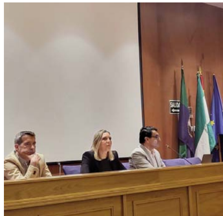
Un momento de la reunión de ayer de la Mesa de la Sequía.