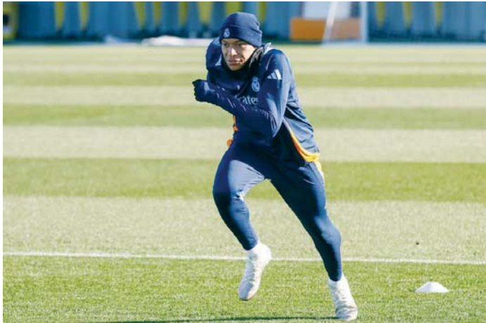
Kylian Mbappé podría tener minutos hoy en la final de la Intercontinental ante Pachuca.

Ya domina el del Mundial de Clubes, que estrena formato en 2025, con la oportunidad para el Real Madrid de proclamarse dos veces campeón del mundo en una misma temporada. Cosas del fútbol moderno y de un calendario que asfixia a los grandes y afecta al rendimiento de los jugadores. Cada temporada más partidos