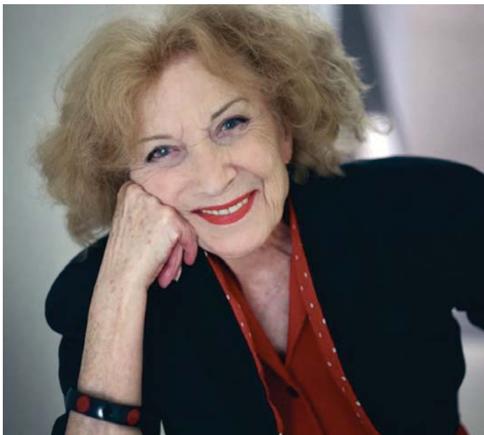
La actriz Marisa Paredes posa durante la entrevista en el Centro Lorca de Granada.

año le llegaron más reconocimientos a su trayectoria: el Premio Pávez del Festival Internacional de Cine de Talavera de la Reina y el Premio de Honor del Festival Internacional de Cine de Granada-Premios Lorca, además del Actúa 2024.