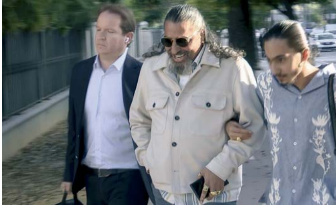
El cantaor Diego el Cigala llega a los Juzgados de Jerez.

La jueza también condena al acusado por un delito de malos tratos agravado en el ámbito de la violencia sobre la mujer, por la agresión co-