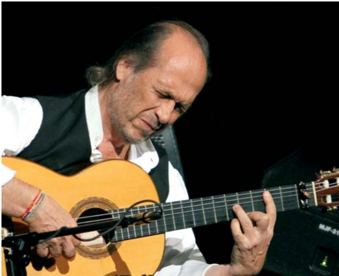
El incomparable guitarrista algecireño Paco de Lucía, en una imagen de archivo.

CULTURA Organizan un espectáculo el próximo sábado en el Florida