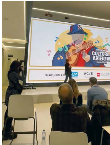
Presentación de la Game Jam Cultura Abierta. DEV

Este concurso, que nació con la idea de sensibilizar a los nuevos creadores sobre la importancia de la propiedad intelectual, obliga a los participantes a hacer una investigación sobre el autor de la obra para saber, por ejemplo, si ha fallecido hace más de 70 años y sus obras pue-