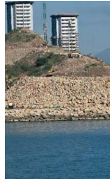
Rellenos de Gibraltar.

ción de la ZEC Estrecho Oriental es competencia del Ministerio para la Transición Ecológica y el Reto Demográfico, no de la Junta de Andalucía”.