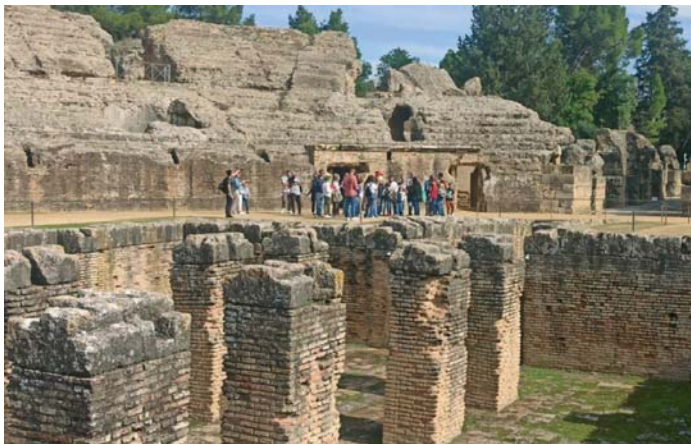
Anfiteatro del conjunto arqueológico de Itálica.

La Asociación Cívica del Sur (Civisur) promovió hace ya más de siete años, el lanzamiento de la candidatura de la ciudad adriana de Itálica, bautizada como 'Itálica, una ciudad adrianea', para esgrimir cómo el enclave refleja la arquitectura y el urbanismo promovidos durante la etapa del emperador Adriano (117-