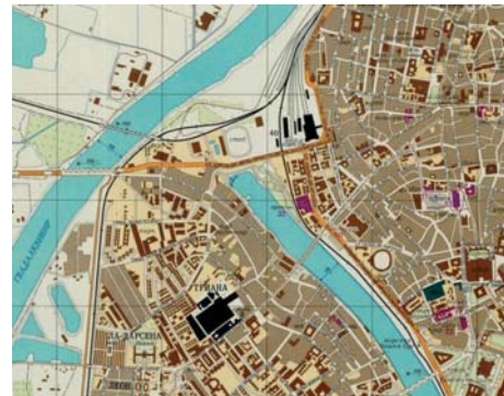
Plano de Triana, en la zona occidental de Sevilla. IECA

La relevancia de Andalucía en este fondo cartográfico en relación al conjunto del país es importante. Es muy significativo que las primeras en levantarse fueran las relacionadas con el Estrecho de Gibraltar: Algeciras (1971) no solo fue la primera de la Península, sino también de toda Europa Occidental disponible en el fondo del ICGC.