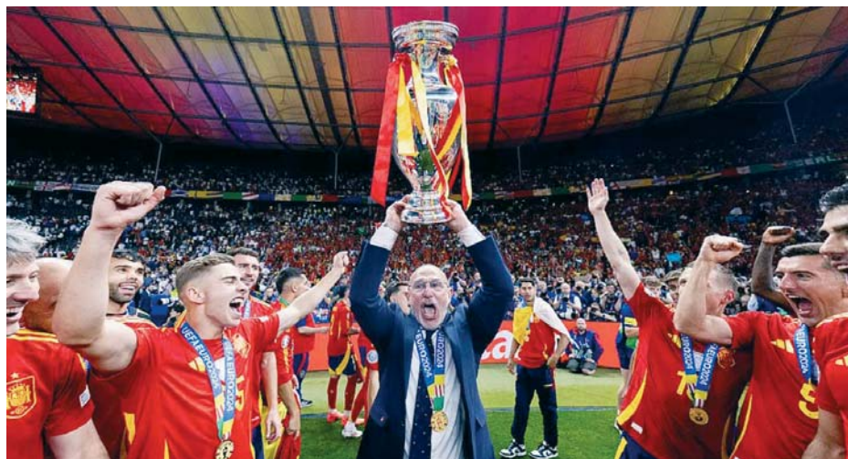
El seleccionador español, Luis de la Fuente, levanta la Eurocopa obtenida el pasado verano en Alemania.

“De reojo todos miramos al Mundial y estamos pendientes de esa gran cita, la más importante del fútbol”