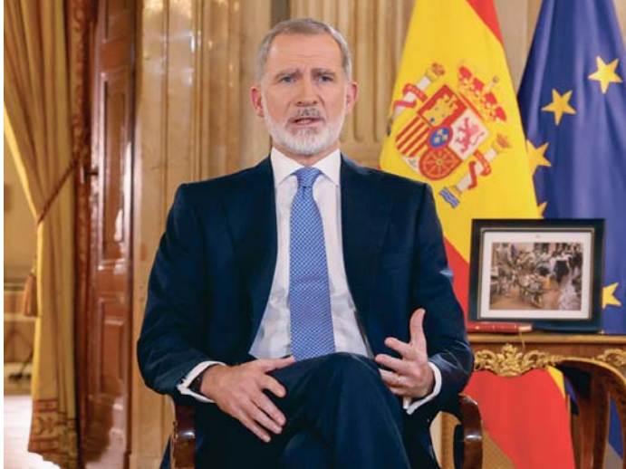
Felipe VI en su tradicional mensaje de Navidad, en el Salón de Columnas del Palacio Real.

Los socialistas destacaron además como prioridades tanto el acceso a la vivienda como una recuperación “lo