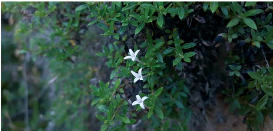
Esta especie solo crece en un paraje concreto de unos 150 metros de San Roque; en ningún otro lugar de todo el continente europeo.

LOCALIZADA Está en un enclave rocoso irregular que se ubica entre el extremo sur de la urbanización de Sotogrande y el arroyo del Guadalquítón