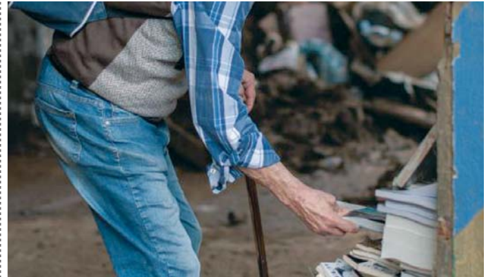
Cientos de miles de ejemplares han sido destruidos.

Este fondo está destinado a la reparación de viviendas, la ad-