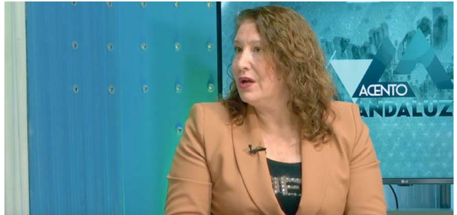
La eurodiputada Carmen Crespo, durante su participación del programa Acento Andaluz de 7TV Andalucía.

En su diagnóstico, Crespo señaló uno de los grandes problemas que agravan la situación: la falta de inversión en obras hídricas. “Estamos perdiendo el 16% del agua. Hay territorios que pierden el 50% del agua por las redes, por no invertir”, denunció