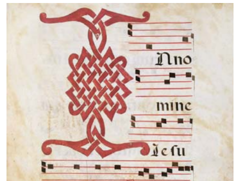
Detalle del libro de coro con notaciones sobre pentagramas.

das sobre pentagramas encarnados. La Biblioteca Nacional posee una importante colección de cantorales, alrededor de 80, y este se ha adquirido para engrosar la colección de libros de coro, generada en su mayor parte por las desamortizaciones decimonónicas, y que “forman parte del patrimonio musical español”, según Ortega.