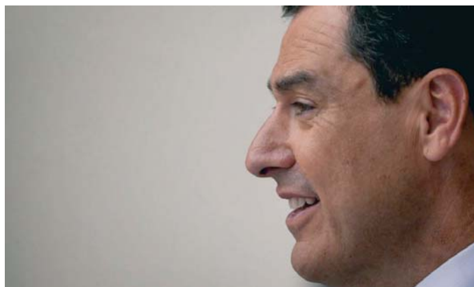
El presidente de la Junta de Andalucía, Juanma Moreno.

Reiteró el compromiso de su gobierno de construir 20.000 viviendas, que se unirán a las alrededor de 13.000 que se están construyendo y ha añadido que se va a elaborar una ley de vivienda, al tiempo que ha apostado por “facilitar las cosas” a los arrendadores y por empezar a hacer más vivienda poniendo suelo público para abaratarlo y hacer promociones. Sobre la polémica por las viviendas turísticas, el presidente de la Junta abogó por el consenso entre las empresas que operan en el ámbito turístico, los ayuntamientos y la Junta.