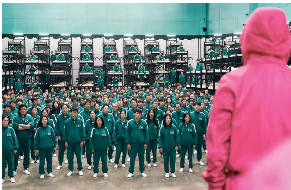
Los jugadores, con sus chándales verdes numerados, esperan en fila la siguiente prueba en 'El juego del calamar'.

Tras más de tres años de espera, se estrena hoy y continuará la historia de Seong Gi-hun, interpretado por Lee Jung-jae, quien regresa al juego con un propósito claro: desmantelar la competición desde dentro