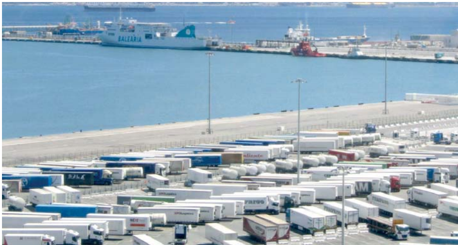
Camiones en el Puerto de Algeciras, que espera superar los 800.000 camiones para el año 2030.

Peró no solo eso, ya que de seguir la progresión como marca la estadística hasta ahora, Algeciras podría estar en disposición de superar a Valencia y ubicarse como segundo puerto de España (primero de la península) en estos tráficos, solo superado por Baleares a nivel nacional. Y es que Valencia, que partía este año con una amplia ventaja, se ha ido desinflando paulatinamente y, pese a registrar también una evolución positiva en este ámbito (un crecimiento del 4,2%), el