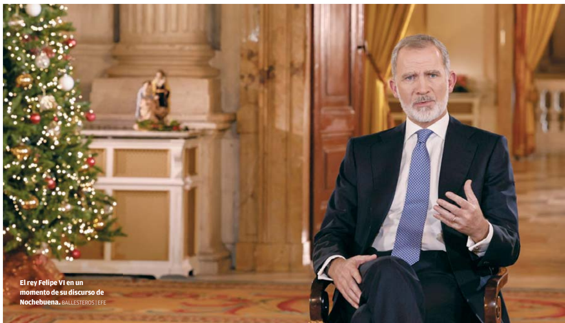
El rey Felipe VI en un momento de su discurso de Nochebuena.

ESTADÍSTICAS A finales de noviembre se habían alcanzado los 463.000 vehículos, después de que ese mes se rozaran los 50.000 ESCALAFÓN Está a un paso de desbancar al puerto de Valencia de su segundo puesto a nivel nacional en estos tráficos PREVISIÓN En 2030, con las dos terminales, se espera llegar a los 800.000 camiones