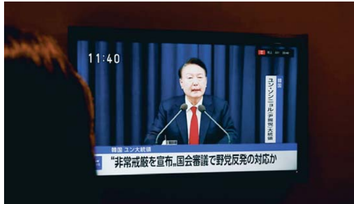
El presidente surcoreano, Yoon Suk-yeol, anunciando la declaración de la ley marcial por televisión.

El anuncio de Yoon se produce después de que el PD aprobara sin contar con el apoyo del gobernante Partido del Poder Popular (PPP) unos presupuestos generales para