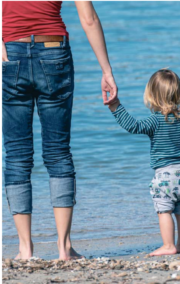
Foto de archivo de una madre en la orilla de una playa.

“Criar es caro, lo que influye en la decisión de tener un hijo” en España, donde nacen 1,16 hijos por mujer, la tasa más baja de toda Europa, remarca este estudio, que calcula el gasto que deben enfrentar las familias en las distintas etapas de la vida de sus hijos