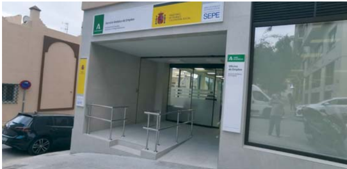
Oficina del Servicio Andaluz de Empleo (SAE) en Algeciras.

DISPARIDAD Algeciras, La Línea y San Roque recuperan empleo pero cae estrepitosamente en Tarifa y Los Barrios