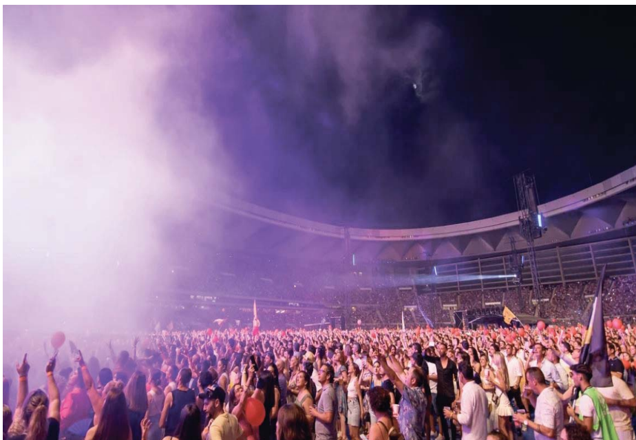
Imagen de archivo de un concierto en el Estadio de la Cartuja de Sevilla durante el verano.

Aumentan también los datos en música clásica. Comparando los resultados