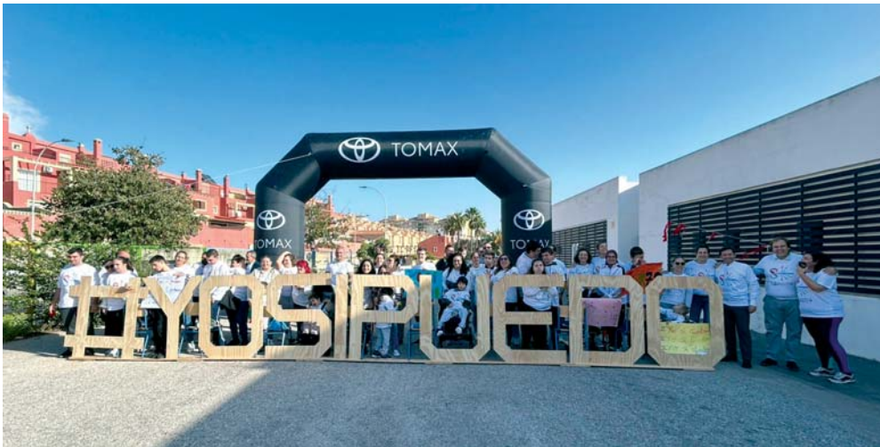
Participantes de la prueba deportiva solidaria 'Yo sí puedo', organizada por el Centro de Educación Virgen de la Esperanza. VIVA CAMPO DE GIBRALTAR

BENÉFICA En esta ocasión, la recaudación de la prueba va para los afectados de la DANA y muy especialmente a menores con diversidad funcional de esa zona