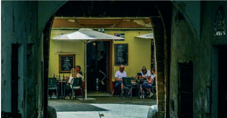
Andalucía fue la cuarta comunidad que más turistas recibió, por detrás de Cataluña, Baleares y Canarias. VIVA

En España, el turismo internacional siguió batiendo récords, con casi 82,9 millones de viajeros extranjeros en estos diez meses, lo que supone un aumento interanual del 10,8 %, que gastaron 110.984