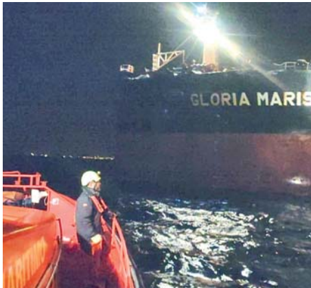
Los buques 'Gloria Maris' (izquierda) y 'HMM ST Petersburg' quedaron retenidos en aguas cercanas al Puerto de Algeciras.

ritima de Algeciras ha ordenado la retención de los dos buques y se va a llevar a cabo sendas inspecciones por parte de los inspectores de seguridad de la misma para tratar de aclarar las causas de la colisión y comprobar a bordo la situación de seguridad de las embarcaciones. Así, tal y como ha explicado Salvamento, el 'HMM ST Petersburg' atra-