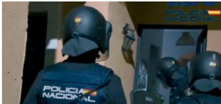
Agentes a punto de entrar en una de las viviendas.

■ ■ La Policía Nacional ha detenido a 8 personas y desarticulado una red criminal para la introducción ilegal de migrantes a través del Estrecho en una operación, denominada 'Prometeo', en la que ha detenido a 8 personas. La red metía a inmigrantes desde Ceuta hasta Algeciras y robaba embarcaciones de recreo con este fin.