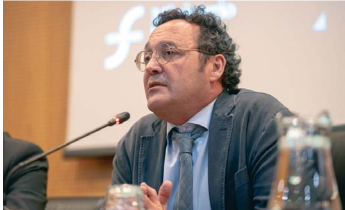
El Fiscal General del Estado, Álvaro García Ortiz, en una imagen de archivo.

La Asociación de Fiscales (AF), mayoritaria en la carrera y de carácter conservador, así como la Asociación Profesional Independiente de Fiscales (APIF) han coincidido