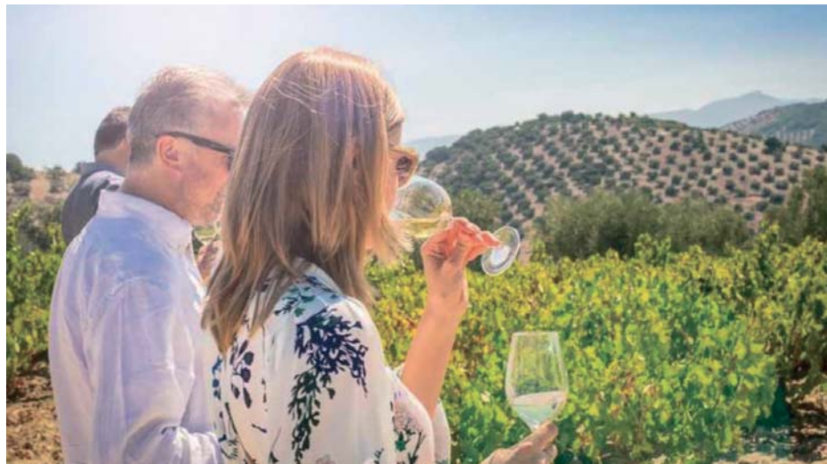
Varias personas asisten a una cata en mitad de los viñedos. ARCHIVO

Las rutas del vino que discurren por Andalucía unen a la perfección los atractivos enológicos, culturales, monumentales y tradicionales de las poblaciones y zonas que las integran