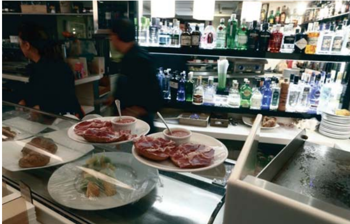
La hostelería es uno de los sectores más golpeados, junto con la agricultura y la construcción. EP

Mientras que en regiones como Navarra (6,3%), el País Vasco (6,6%) y Madrid (7%) la pobreza laboral se mantiene por debajo del 10%, en Andalucía las cifras son más preo-