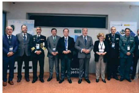
Autoridades presentes en la jornada sobre seguridad portuaria.

A lo largo de la mañana, se impartieron cuatro ponencias: Estado actual de la protección y seguridad portuaria , Desarrollo e innovación tecnológica aplicada a la protección y seguridad portuaria , Singularidades de la Policía Portuaria en diversos entornos portuarios e Interacción entre los principales actores de la protección y de las infraestructuras críticas en el ámbito portuario: el OPP, el OPIP, el CISO y el responsable de seguridad y enlace .