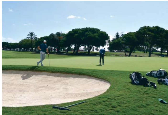
Una de las ediciones anteriores del Estrella Damm Andalucía Masters de golf en San Roque. VIVA CG

El golfista polaco Adrian Meronk ganó la edición de 2023, la primera que se disputó en el Real Club de Golf de Sotogrande, ya que las anteriores tuvieron lugar en el Real Club de Valderrama