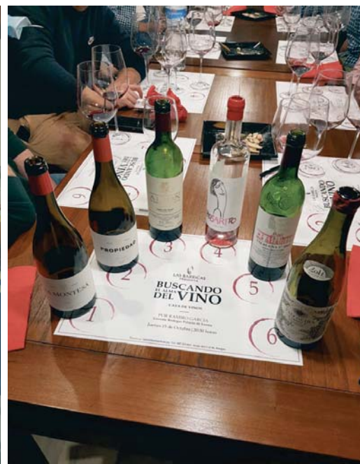
Vinos de la Bodega del Palacio de Lerma, Burgos. Castilla y León.