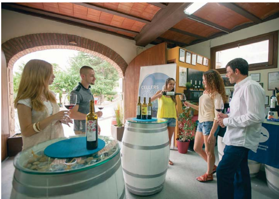
Una cata de vinos en las bodegas Cellers Baronia del Montsant en Cornudella de Montsant, Tarragona.

VALORES AÑADIDOS El sector vinícola es de extraordinaria relevancia no solo desde el punto de vista económico o medioambiental, sino también cultural PROYECCIÓN TURÍSTICA El vino contribuye a la imagen de su zona de producción y cada vez más supone todo un polo de atracción de visitantes y turistas a través de sus rutas