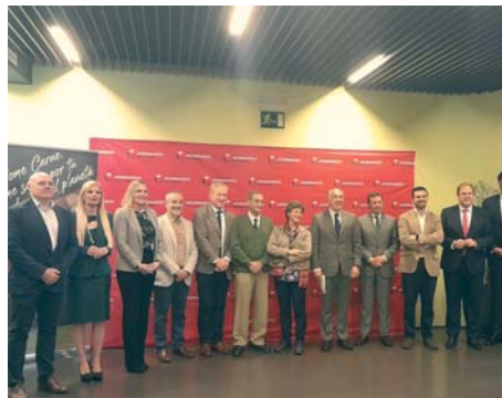
Jornada 'Come carne, come sano' en el teatro Florida.

Los participantes en esta iniciativa son estudiantes procedentes de los IES Kursaal, Ventura Morón y el CE- PER Juan Ramón Jiménez de Algeciras.