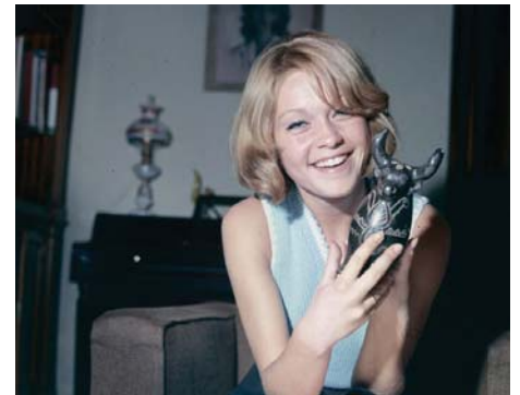
La cantante y actriz Pepa Flores, Marisol, en imagen de archivo.

Por sus pinceles han pasado los reyes Juan Carlos I y Felipe VI, la reina Sofía, la reina Isabel II de Inglaterra, Fidel Castro, Montserrat Caballé o la exprimera dama de EE.UU. Barbara Bush, entre otros.