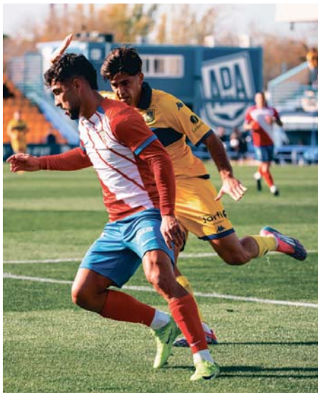
Lance del partido Alcorcón-Algeciras.

Neco Celorio ingresó al campo en el minuto 35, y apenas un minuto después, el portero del Alcorcón, Gaizka, se lució con una parada espectacular que evitó