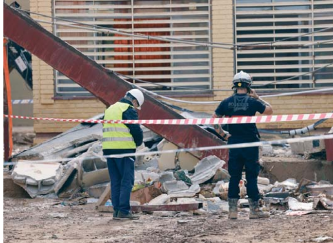
Bomberos en la zona colapsada en el colegio Lluís Vives de Massanassa (Valencia).

"Un suceso de estos te deja hoy más triste de lo que estamos", dijo Comes, quien in-