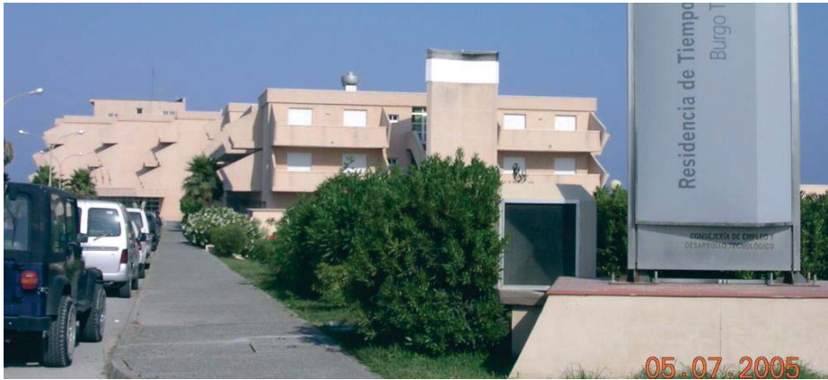
Residencia de tiempo libre El Burgo Turístico, de La Línea, cuyo cese de gestión pública se anunció en noviembre del pasado año.

Así, el futuro de El Burgo Turístico pasaba por la aplicación de un proceso de licitación y concesión para que una entidad privada se haga cargo de su gestión en el futuro, un proceso que todavía,