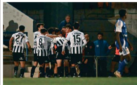
Los jugadores de la Balona celebran uno de los dos goles.

Buscó el empate el Xerez CD, pero resistió la Balona. Al final, los dos equipos protagonizaron una tãngana en el área que se vio agravada por lanzamientos de varios objetos desde la grada.