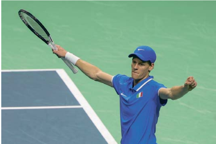
Jannik Sinner celebra su victoria en la final de la Copa Davis celebrada en Málaga.

Acabó Sinner la tarea y antes de celebrar el segundo éxito consecutivo para la escuadra azzurra fue a felicitar al rival. El equipo revelación del torneo al que no le bastó con el instinto de supervivencia que mostró a lo largo de la competición y que reflejó Griekspoor, sobre todo en la primera manga, cuando llevó