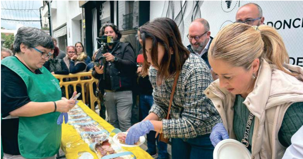
La tosta gigante de la calle La Plata ha sido un peculiar evento gastronómico en el que han participado activamente los vecinos de Los Barrios.

IBÉRICOS Productos del cerdo ibérico como el jamón, chorizo, salchichón, morcilla y su aceite de oliva han formado parte de este peculiar evento gastronómico