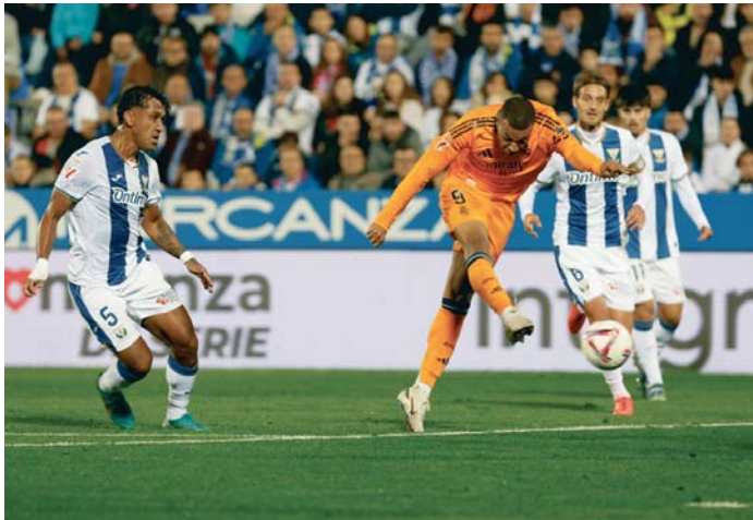
El delantero Kylian Mbappé (c) remata a puerta ante los jugadores del Leganés.

Un lanzamiento de falta de Valverde dispuso las esperanzas del equipo leganense de tratar de cambiar el rumbo (m.66), y un testarazo de Bellingham tras un balón al larguero (m.85) dio la puntilla a un partido en el que se vio a un