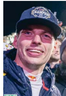
Max Verstappen.

cuatro títulos mundiales de Fórmula Uno con los que cuentan el francés Alain Prost y el alemán Sebastian Vettel, al proclamarse en el GP de Las Vegas tetracampeón del mundo.