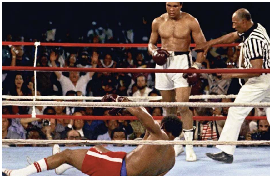
Momento del célebre combate entre Muhammad Ali y George Foreman.

En cuanto al otro contendiente, George Foreman, hoy con 75 años, colgó