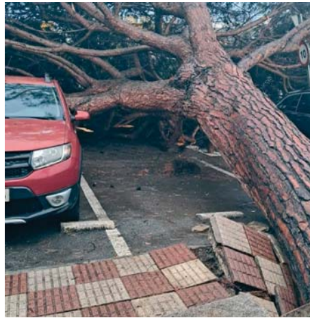
El árbol caído justo en una plaza vacía entre dos coches.