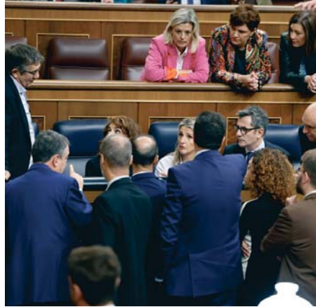
El Congreso reúne a los portavoces para suspender el pleno.

Una crítica compartida por Vox, que reprochó el “espectáculo dantesco” del PSOE y sus socios “en mitad de una desgracia de este calibre”, como sostuvo su portavoz en la Cámara, Pepa Millán.