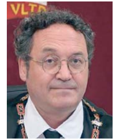
Álvaro García Ortiz.