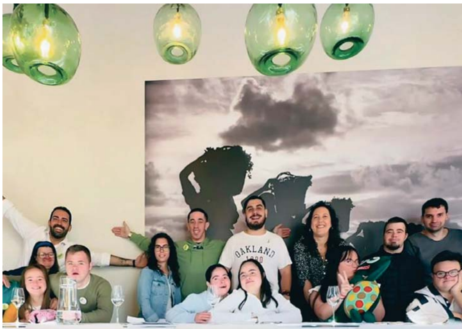
Foto de familia de los participantes en la iniciativa formativa ‘Enoturismo para tod@s’ impulsada por la Ruta del Vino y el Brandy.

La gala de entrega de premios tendrá lugar el 15 de noviembre en el Museo Reina Sofía de Madrid.