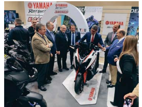
Inauguración del Salón del Motor de Ocasión de Sevilla. FEDEME

Entre las novedades de este año, se encuentra la Zona Eco y la presentación de varios modelos de vehículos eficientes y eléctricos. Además, marcas como Yamaha, Aprilia y muchas otras estarán presentes con sus últimos modelos.