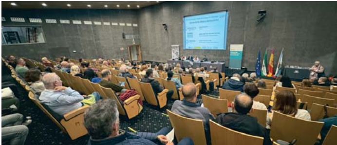
Inauguración de la Feria de Empleo Verde en el Palacio de Congresos de La Línea de la Concepción.

OPORTUNIDADES Representantes de 20 empresas acuden también a la cita, que fomenta la recualificación