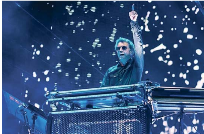
El compositor y artista galo Jean-Michel Jarre durante uno de sus últimos conciertos.

Jarre es conocido por sus actuaciones en lugares icónicos, entornos emblemáticos declarados Patrimonio de la Humanidad por la UNESCO en todo el mundo, utilizados como lienzo para sus mensajes creativos, culturales y ambientales.