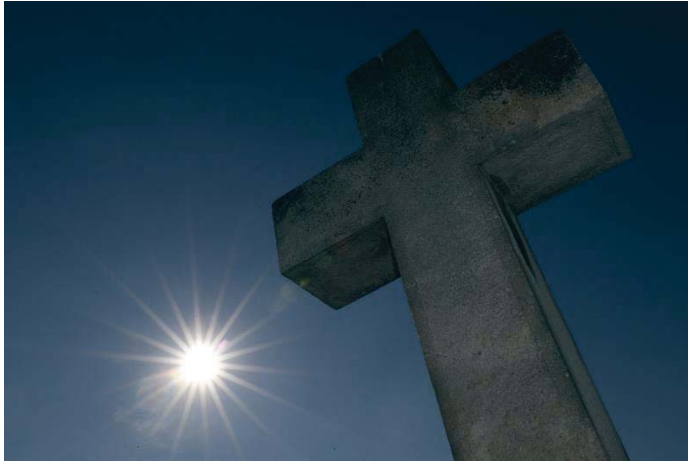
El 1 de noviembre se celebra el Día de Todos los Santos.

Crema pastelera, chocolate, nata, batata y cabello de ángel son los rellenos más tradicionales de los buñuelos, que han evolucionado hacia opciones más innovadoras y hoy en día, es posible encontrar sabores como trufa, café, marrón glacé, Baily's, frambuesa, y la última novedad y tendencia de los