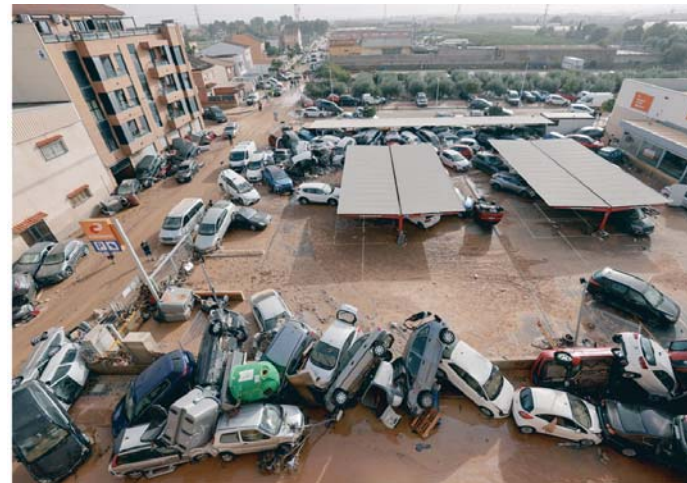
Vista general de vehículos dañados en Paiporta, tras las lluvias causadas por la DANA.

Más de 22.000 transportistas se han visto afectados por el cierre de los principales ejes