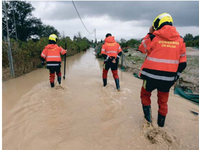
Un grupo de bomberos inspeccionan la barrida de Doña Ana en Cártama en Málaga.

Por su parte, el presidente andaluz, Juanma Moreno, volvió a pedir a los ciudadanos que tengan precaución porque la comunidad mantiene avisos por lluvias intensas. "Evitemos desplazamientos innecesarios y mucho cuidado con la crecida del cauce de los ríos en