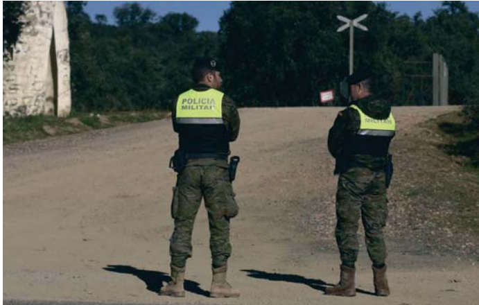
Militares acordonando la zona.

El juez dictó el pasado 29 de julio pasado un auto de procesamiento contra seis mandos de la base militar de Cerro Muriano, donde tiene su sede