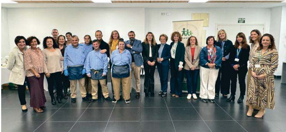
Representantes de Asansull y de la Asociación de Grandes Industrias (AGI) del Campo de Gibraltar, durante el encuentro empresarial.

JORNADA La entidad reúne a empresas e instituciones asociadas de la AGI del Campo de Gibraltar para informar y sensibilizar sobre la inclusión laboral