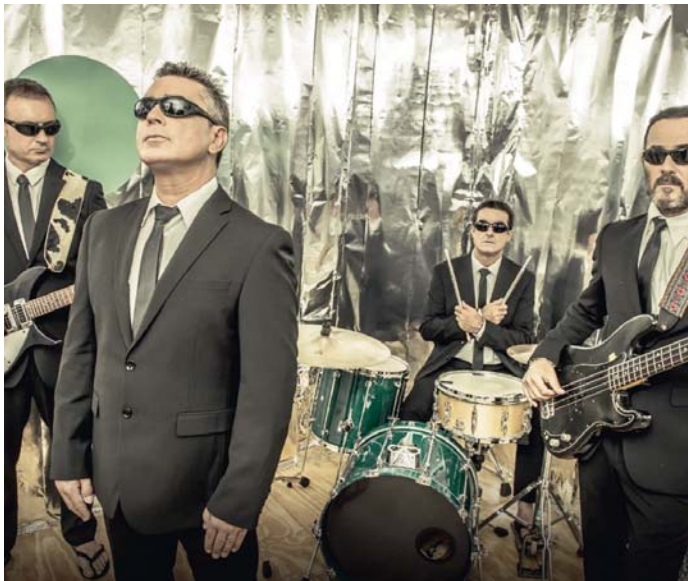
Los 'Chanclas', dispuestos a celebrar una gran fiesta en Sevilla por sus 35 años de carrera.

Asegura que para mantenerse y contar con ese apoyo incondicional del público pese al paso del tiempo es "muy importante la humildad y la salud musical que el grupo lo demuestra en directo" porque "la música tiene dos vertientes muy diferentes, una es tu discografía, lo que tu grabes y