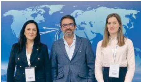
Representación del Puerto de Algeciras con socios en Estambul.

La participación del Puerto de Algeciras en Logitrans es consecuencia de las nuevas tendencias de nearshoring en la que mercados como Turquía o Marruecos juegan cada vez un papel más fundamental en los intercambios con el mercado europeo.