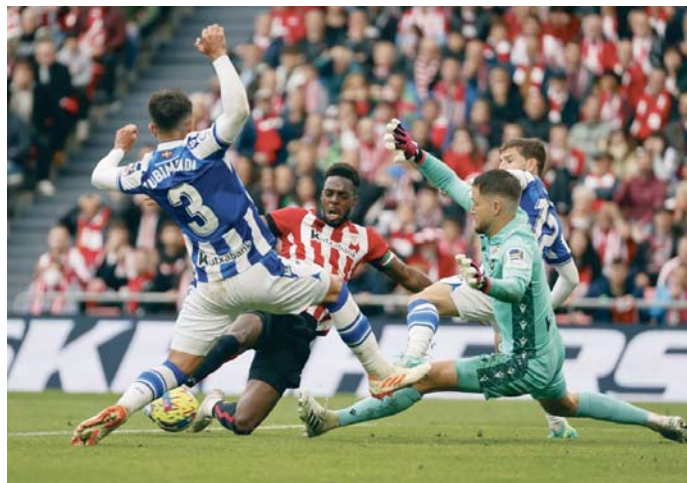
Iñaki Williams remata una jugada de ataque de su equipo durante el derbi.

El Barcelona dispone de seis puntos de ventaja sobre el Real Madrid, si bien el cuadro de Carlo Ancelotti tiene aún pendiente el encuentro en