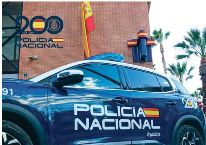
La investigación fue llevada a cabo por agentes del Cuerpo Nacional de Policía. VIVA CAMPO DE GIBRALTAR

Los agentes comprobaron que al menos trece de esas personas nunca habían residido en dicho domicilio. Estas habrían pagado hasta