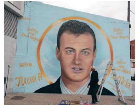
El artista realizando los últimos retoques al mural.