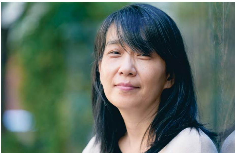
Fotografía de archivo de la escritora surcoreana Han Kang, que es la ganadora del Premio Nobel de Literatura 2024.

Han Kang (Gwangju, 1970) procede de una familia vinculada a la literatura -su padre es un reputado novelista- y, aparte de por la escritura, se ha interesado mu-