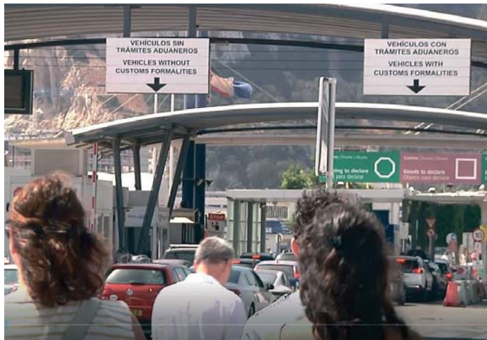
Frontera entre La Línea y Gibraltar, donde iban a comenzar los controles en noviembre.

“La fecha del 10 de noviembre ya no está sobre la mesa, espero que sea lo antes posible pero no hay un nuevo plazo por el momento”. Con estas palabras, la comisaria eliminaba el plazo límite que el ministro de Exteriores de España, José Manuel Albares, daba a Reino Unido para dar el Sí a la propuesta planteada por España con el fin de evitar las consecuencias que la entrada en vigor de estos controles tendrá, principalmente