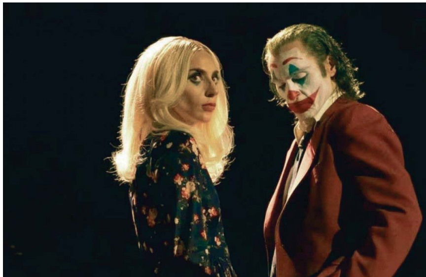
Lady Gaga y Joaquin Phoenix en una de las escenas musicales que incluye esta segunda entrega de Joker .

A Phillips, en cualquier caso, hay que agradecerle el empeño y el riesgo asumido en el retrato de un paria atormentado y sin futuro que busca en este caso la redención a través del amor verdadero, como consecuencia del flechazo que siente por una compañera del psiquiátrico con la que conecta