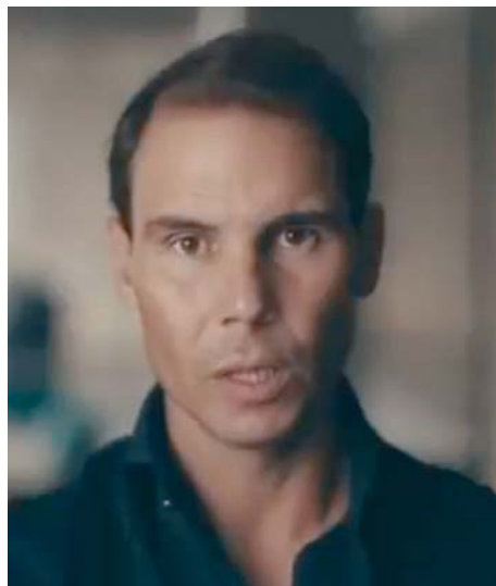
Rafa Nadal durante el vídeo de despedida.

cado con Rafa Nadal, empezando por el que fue durante muchos años el principal rival del español, el suizo Roger Federer, que aseguró que había sido un “absoluto honor” haber competido con el balear.