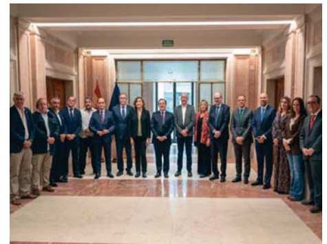
El Grupo Transfronterizo, reunido con Albares en Madrid.

Recuerdan, asimismo, que “siempre hemos valorado de forma muy positiva el acuerdo político del 31 de diciembre de 2020, conocido como el Acuerdo de Nochevieja, toda vez que venía a responder a los anhelos de la sociedad representada en el GT”.