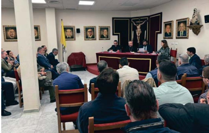
La reunión de hermanos mayores fue presidida por monseñor Rico Pavés.

De hecho, en estos próximos días se terminará en qué iglesias y a qué horas hay celebraciones previstas para la tarde del sábado 19 para, llegado el caso, trasladar inclu-