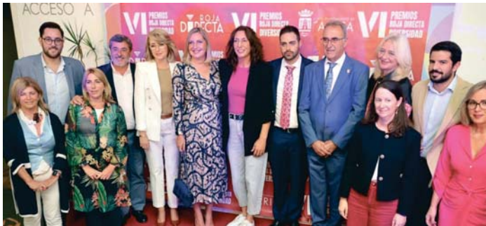
Entrega de los premios de Roja Directa en la gala celebrada en Tarifa.