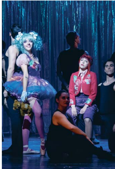
Un momento del pase gráfico del musical 'Gypsy'.

Sobre el escenario un reparto de 30 actores, 26 músicos, 150 piezas de vestuario y 17 cambios escenográficos para dar vida a un musical, una fábula, una experiencia inspirada en las memorias de la artista de burlesque Gypsy Rose Lee. La trama gira en