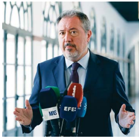
El secretario general del PSOE-A, Juan Espadas.

una “transformación profunda” en su acción política y una “regeneración y renovación” del proyecto, que tenga “decisión propia” en la defensa de los intereses de Andalucía, después de cuatro derrotas electorales del PSOE, una caída del suelo electoral a los 880.000 votos en las autonómicas de 2022, con 30 diputados socialistas frente a los 58 del PP y con las últimas encuestas indicando un empeoramiento dramático.