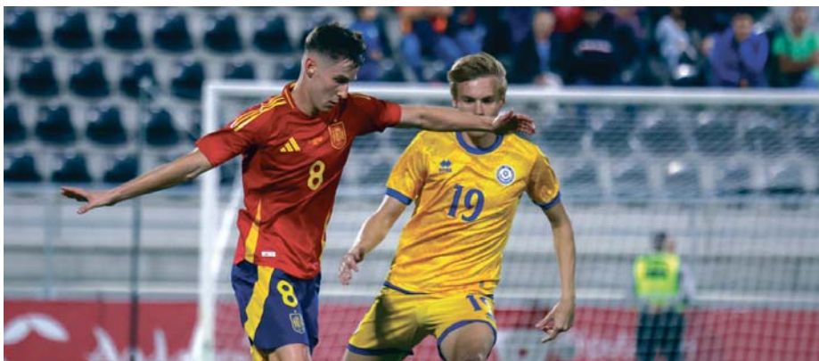
Lance del partido que España le ha ganado a Kazajistán en el Estado Municipal de La Línea de la Concepción.

LA LÍNEA | La selección española sub-21 venció este jueves por 4-3 Kazajistán, con tres