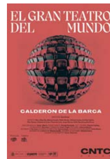
Cartel anunciador de la obra.

El gran teatro del mundo es una obra paradigmática en ese sentido, pues "conjuga un imaginario escénico inédito en su tiempo y una versificación de una extraordinaria belleza con