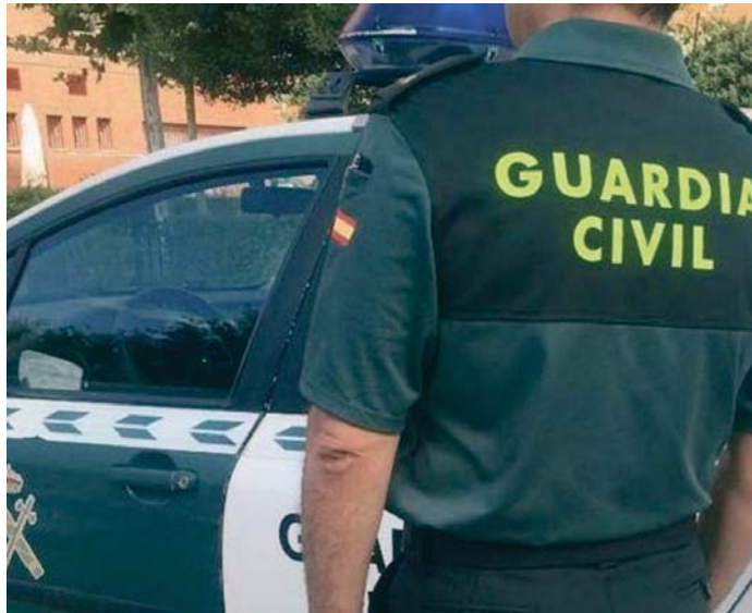
Imagen de archivo de un agente de la Guardia Civil ante un coche patrulla.

El tiroteo en el que se produjo la muerte fue el segun-