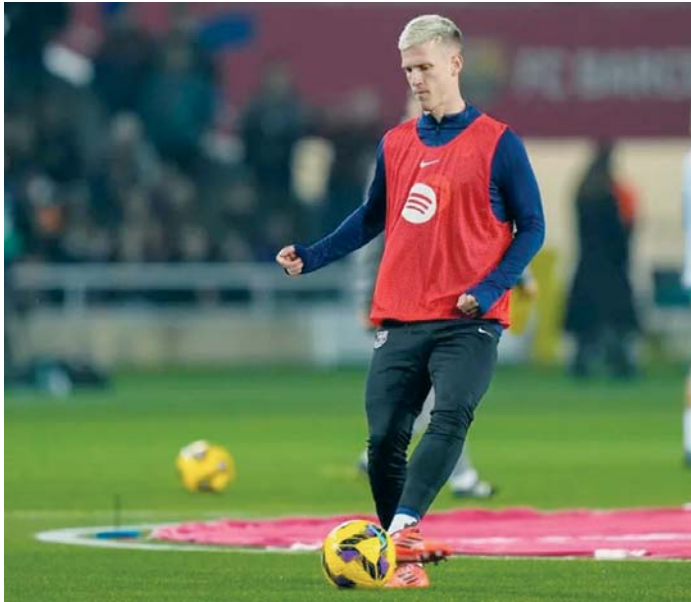
El delantero del Barcelona Dani Olmo.

Y es que para que la entidad azulgrana pudiera operar en el mercado con la regla 1:1 del fair-play financiero e inscribir a ambos jugadores, LaLiga le exigía aportar, antes de este 1 de enero, toda la documentación relativa a los contratos con los dos inversores de Oriente Medio que han entrado en la operación y acreditar el cobro de un anticipo por la cesión de esos palcos del nuevo estadio. De hecho, LaLiga informó la noche del martes en un comunicado que el Barcelona no había presentado "ninguna alternativa" que, atendiendo al cumplimiento de la normativa de control económico de la patronal de clu-