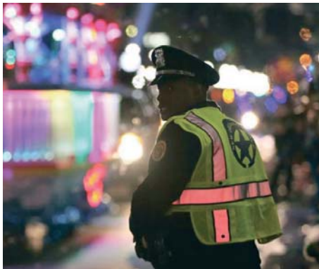
Vista de un oficial de la Policía de Nueva Orleans.

El atacante, que conducía una furgoneta blanca con matrícula de Texas, aceleró hacia la calle de Bourbon Street, en el Barrio Francés, poco después de las 03.00, e impactó contra la muchedumbre que se encontraba en esa vía cerrada al tráfico tras la entrada del Año Nuevo, según describió en rueda de