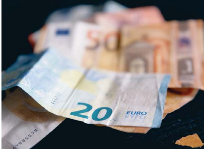
El precio de muchos productos y servicios se han visto incrementados con la entrada de año.

Ya a finales de 2023 se comenzó a desmontar la rebaja fiscal que se había adoptado