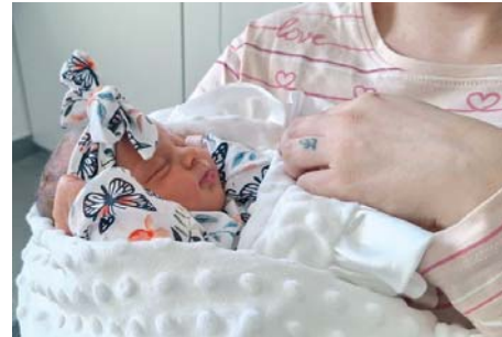
Arabia nació con 50 centímetros y 3,570 kilos de peso. VIVA CG

ambos de La Línea de la Concepción. Xiomara tiene 23 años y su pareja, José Javier, 28, y son primerizos. Arabia es su primer retoño.