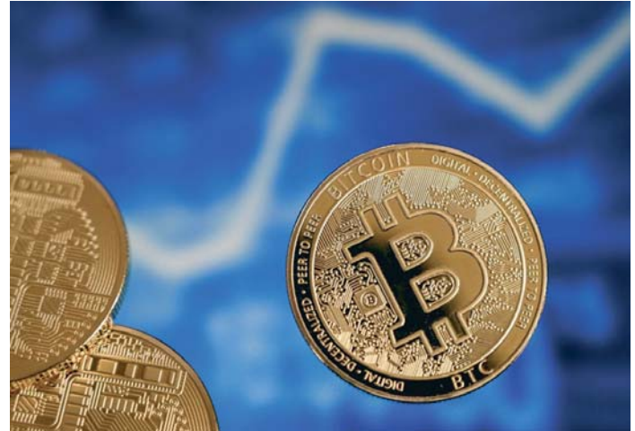
Imagen de archivo de bitcoíns.

MiCA establece que los proveedores cripto para poder operar tienen que obtener una licencia otorgada por el regulador de cada país. En el caso de España, es la Comi-