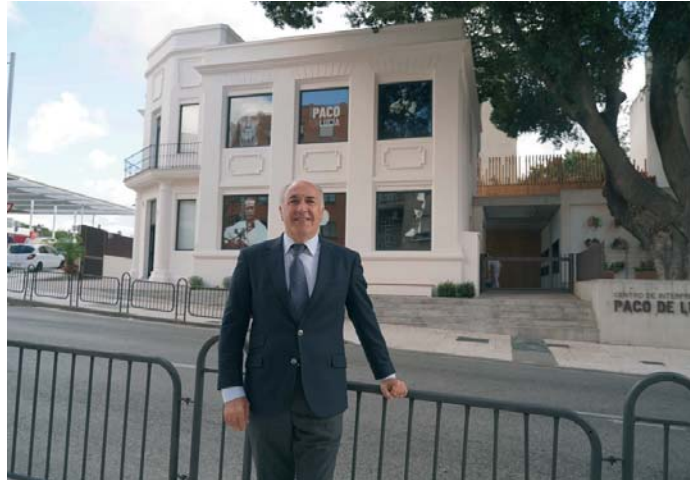
El alcalde de Algeciras, José Ignacio Landaluce, posa con la fachada del centro Paco de Lucía de fondo.

El regidor destacó, además, el éxito de las celebraciones tradicionales y eventos culturales que marcaron el calendario de 2024, entre ellos el Carnaval Especial, la Semana Santa, Navidad Especial, la