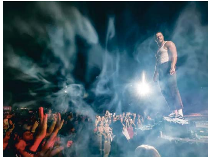
Dan Reynolds, líder de la banda de Imagine Dragons, en concierto.

Dos de los artistas con más escuchas en Spotify España en 2024 vendrán en primavera. El