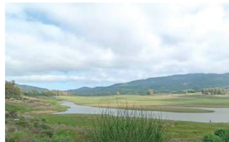
El embalse de Charco Redondo, en fechas recientes.

Actualmente cuentan con 515,95 hectómetros cúbicos de agua embalsada sobre