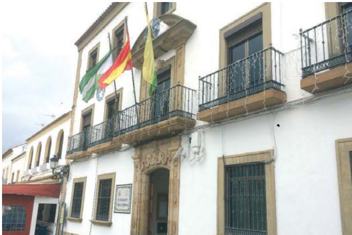
Fachada del Ayuntamiento de Los Barrios, que ha ofertado 27 plazas de empleo público.