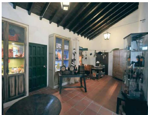
Estancias de las instalaciones del Ecomuseo Lagar de Torrijos.

intentos por reactivar la producción, los lagares comenzaron a caer en el olvido y muchas de estas antiguas fincas fueron abandonadas o demolidas.