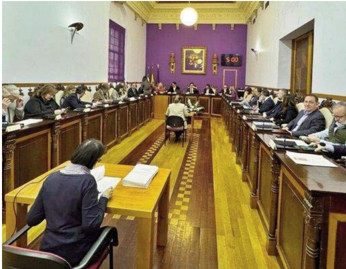
Pleno celebrado tras el primer intento de moción de censura. ESPERANZA CALZADO

Esta segunda moción, en principio, cuenta con el respaldo de los once concejales del PSOE y los tres ediles de Jaén Merece Más (JM+), formación que ha roto su acuer-