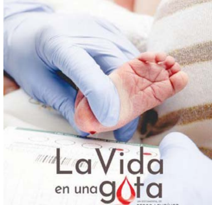
Cartel anunciador de la película 'La vida en cada gota'.