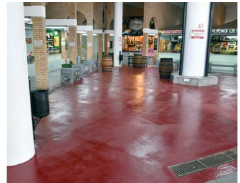
Puestos de uno de los mercados de San Roque.

La documentación se puede consultar en el Perfil del Contratante, ubicado en el portal web del Ayuntamiento ( https://sanroque.sedelectronica.es/?x=OOT2IUJJEgdkhxLEYIKRQ ).