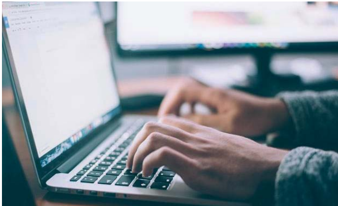
El crecimiento del número de empresas inscritas en Andalucía ha duplicado al del año anterior. AI

Respecto a las cifras globales, el 20 por ciento de todas las empresas inscritas en la Seguridad Social en España